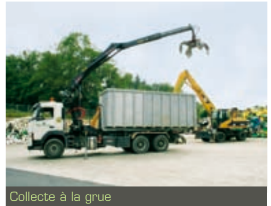
Collecte à la grue