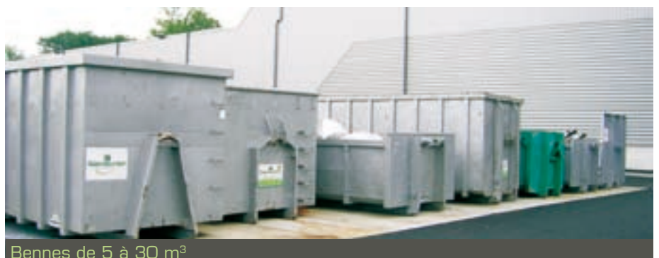
Bennes de 5 à 30 m 3