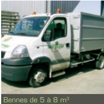
Bennes de 5 à 8 m 3