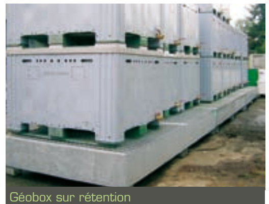
Géobox sur rétention