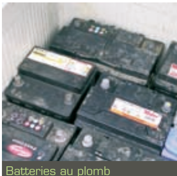
Batteries au plomb