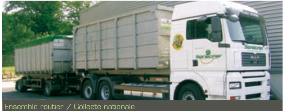
Ensemble routier / Collecte nationale