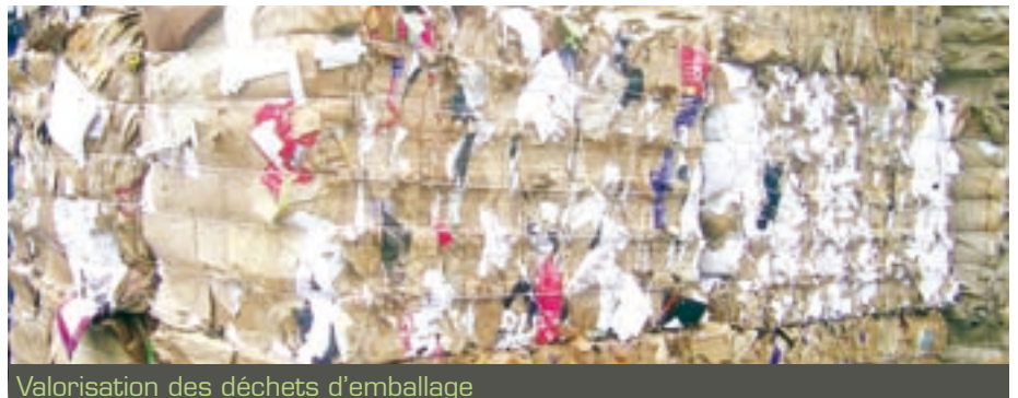
Valorisation des déchets d'emballage