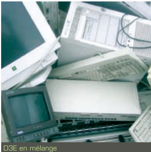
D3E en mélange

Situé au croisement des deux autoroutes européennes (E70-E09), SORECFER vous propose son centre dédié aux déchets d'équipements électriques et électroniques en fin de vie :